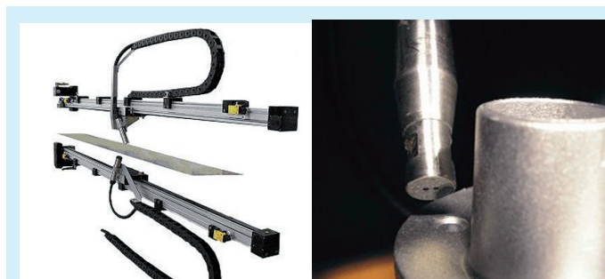
Bild 2a: Traversiereinheit für Blech: Ober- und Unterseite Bild 2b (rechts): Beispiel Messung an einem Bauteil

Die Zeitabhängigkeit der registrierten Fluoreszenzsignale liefert zudem in weiten Grenzen stoffspezifische Informationen. Dadurch besteht insbesondere für die Reinheitsüberwachung einerseits die Möglichkeit, bekannte Kontaminationen gezielt zu erfassen, d.h. spezifisch auf die